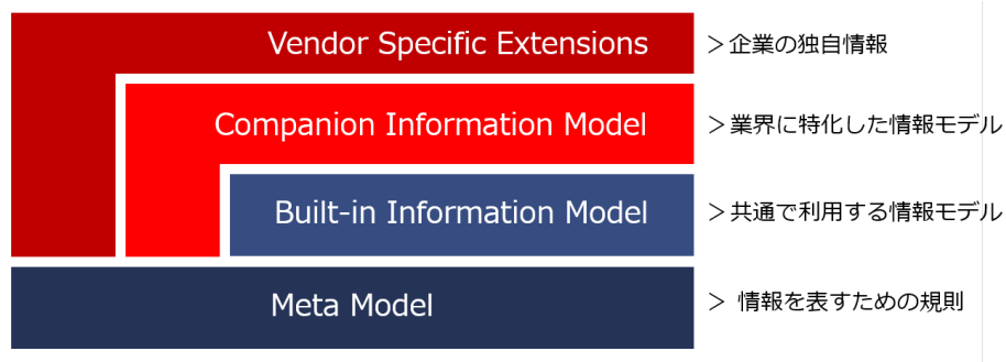
<OPC UA の情報モデル構成>