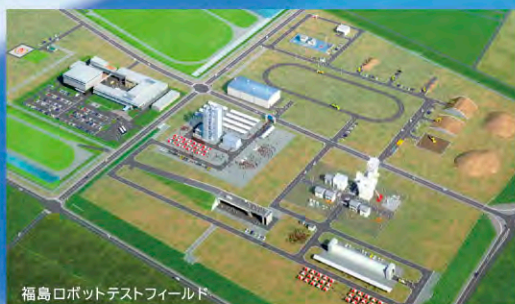
福島ロボットテストフィールド