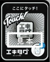
エキタグタッチポイント

駅などに設置されたNFCタグをスマートフォンで読み込むことで、設置された場所のスタンプをアプリ内のデジタルスタンプ帳に収集することができます。駅に設置されたスタンプのほか、期間限定のスタンプやイベントに連動したスタンプなどにも対応しています。