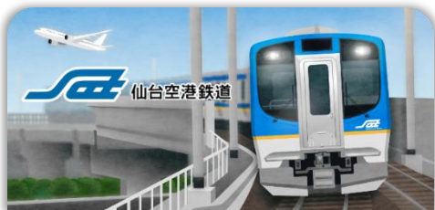
仙台空港鉄道スタンプ帳ラベル