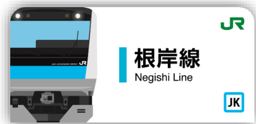
根岸線スタンプ帳ラベル