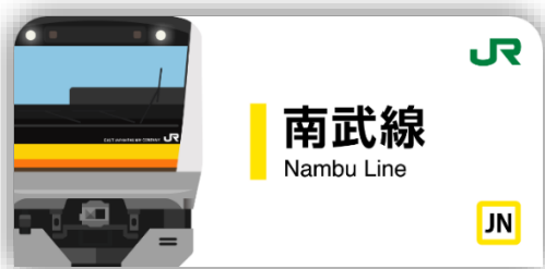
南武線スタンプ帳ラベル