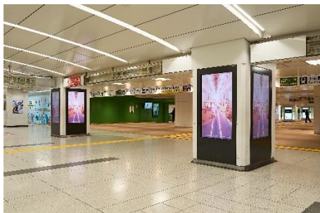
デジタルサイネージ

4月1日以降、「TRAIN TV」開局を記念し、首都圏JR主要路線の中ぶり・まど上ポスター・車内モニター・山手線車体広告や、主要駅のポスター・デジタルサイネージ・大型サインボードにて、大規模なプロモーションを展開します。