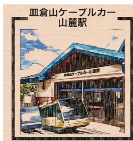
血倉山ケーブルカー 山麓駅