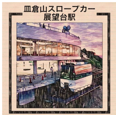
皿倉山スロープカー展望台駅