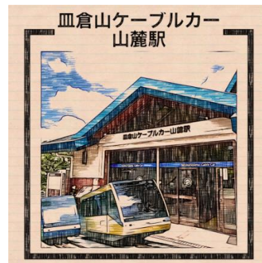
皿倉山ケーブルカー山麓駅