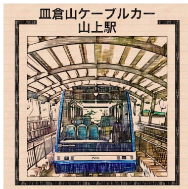
皿倉山ケーブルカー山上駅