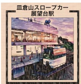
血倉山スロープカー 展望台駅