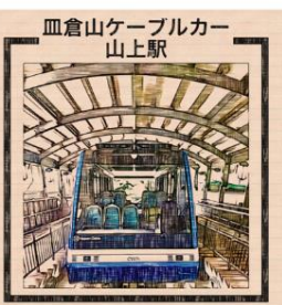
血倉山ケーブルカー 山上駅