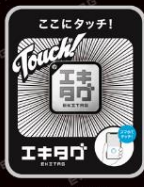
▲ NFC タグ

駅などに設置された NFC タグをスマートフォンで読み込むことで、設置された場所のスタンプをアプリ内のデジタルスタンプ帳で収集することができます。駅に設置されたスタンプのほか、期間限定のスタンプやイベントに連動したスタンプなどにも対応しています。