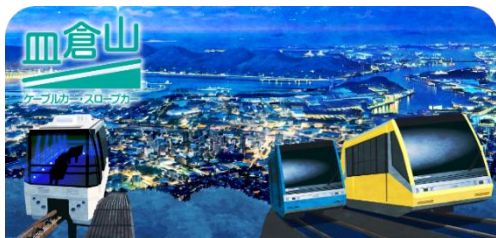
スタンプ帳ラベルデザイン