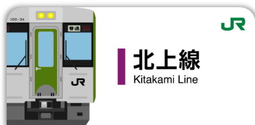
北上線スタンプ帳ラベル