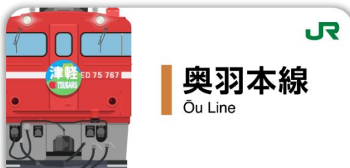
奥羽本線スタンプ帳ラベル