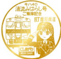
キハ40 清流みはらし号