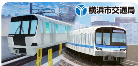
スタンプ帳ラベル