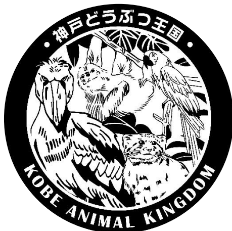
神戸どうぶつ王国 限定デジタルスタンプイメージ