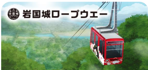
岩国城ロープウェースタンプ帳ラベル