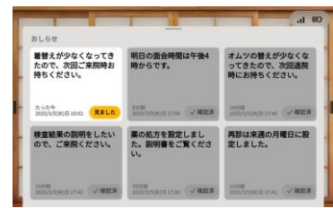
「施設スタッフからメッセージ通知」