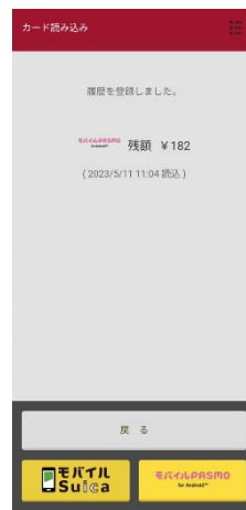
読み取り結果画面