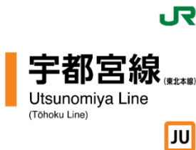
宇都宮線（東北本線）スタンプ帳ラベル