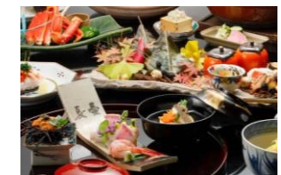
お食事 ※画像はイメージです