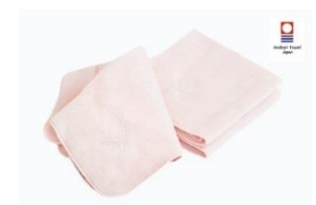
アンブルール オリジナル今治ハンドタオル