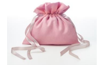
アンブルール オリジナルロゼポーチ