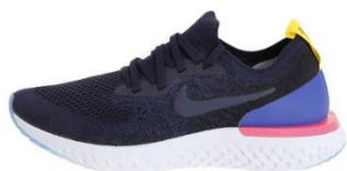
全国の一部取り扱い店のみでの 限定販売 「ナイキエピックリアクトフライニット」