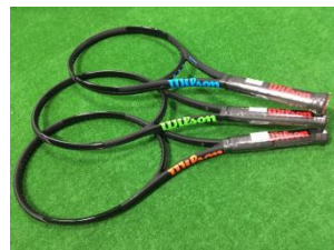
全国の一部取り扱い店のみで 先行限定販売 ウィルソン「黒の無限」シリーズ