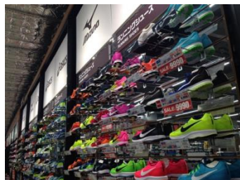
①専門店レベルの品揃え