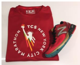
全国11店舗での限定販売 ニューバランスNYCマラソンモデル