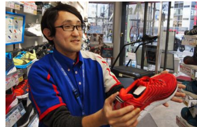
③専門知識をもった 販売員による商品提案