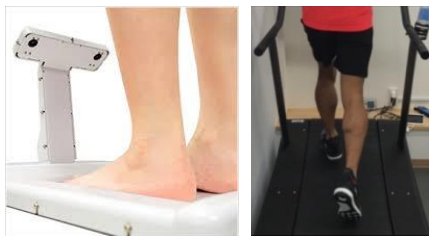
②測定器によるアナライズ