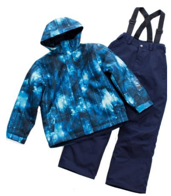
ブランド：ARBN nature 商品名：SPACE GEO BOY ST 価格：15,900円（税込）