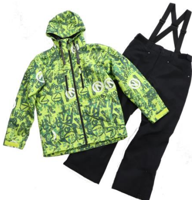
ブランド：ARBN nature 商品名：GRAFFITIST 価格：19,900円（税込）

昨年より発売を開始し、好評を博した「スキボウェア」が今年も「スーパースポーツゼビオ」「ヴィクトリア」にて発売となります。スキーとスノーボードのウェアには機能・デザインともに違いがありますが、その両方を兼ね備えたウェアが「スキボウェア」です。「スキボウェア」なら、その日の気分に合わせてスキーでも、スノーボードでも、どちらでも楽しむことができます。また、今年もジュニアモデルが初登場。どちらか片方しかやることがない人も、このウェアをきっかけに両方楽しんでみてはいかがでしょうか？