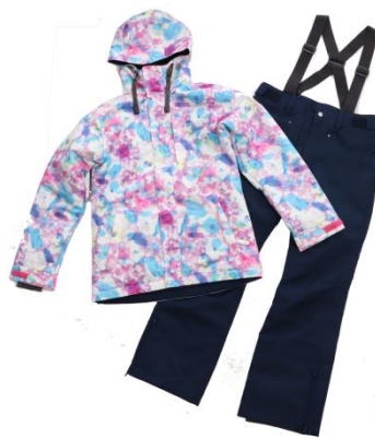
ブランド：arg nature 商品名：MULTI FLOWER ST 価格：19,900円（税込）