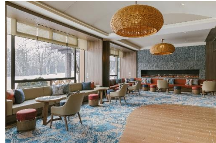
バー(終日オープン):Wakka