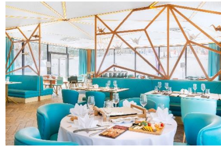
メインレストラン:Daichi

メインレストラン。北海道ならではの味覚はもちろん、世界各国のお料理が並ぶビュッフェスタイル