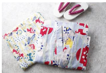
お子様浴衣(イメージ)

また、すぐ横を流れる目黒川や、目黒不動尊(ホテル雅叙園東京より徒歩約10分)、大鳥神社(ホテル雅叙園東京より徒歩約10分)など浴衣で目黒の名所散策もおおすすめです。今年の夏はホテル雅叙園東京で非日常的な時間をお過ごしください。