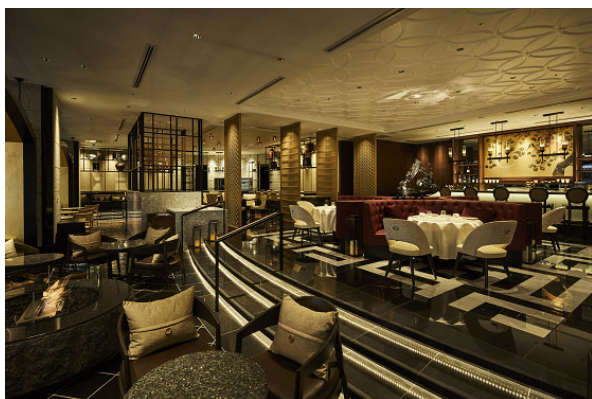
New American Grill “KANADE TERRACE”内観

https://www.hotelgajoen-tokyo.com/archives/52741