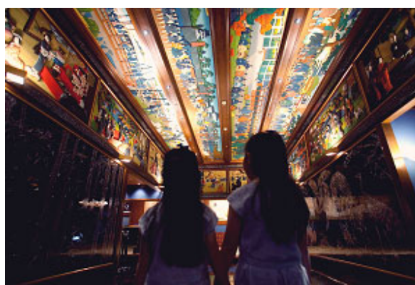
親子アートツアー(イメージ)

「親子で学べるテーブルマナー」は、オープンキッチンの窯で焼き上げるグリル料理やアフタヌーンティーが人気の、New American Grill “KANADE TERRACE”にて、ナイフ・フォークの使い方などの作法だけでなく、レストランの種類やレストランスタッフの職業紹介など、ホテルのレストランで食事を楽しむための基本的なマナーや秘訣を、実際に食事を楽しみながら、西洋料理テーブルマナー講師がわかりやすく説明します。講義終了後にはディプロマ(受講証明書)をお渡しいたします。