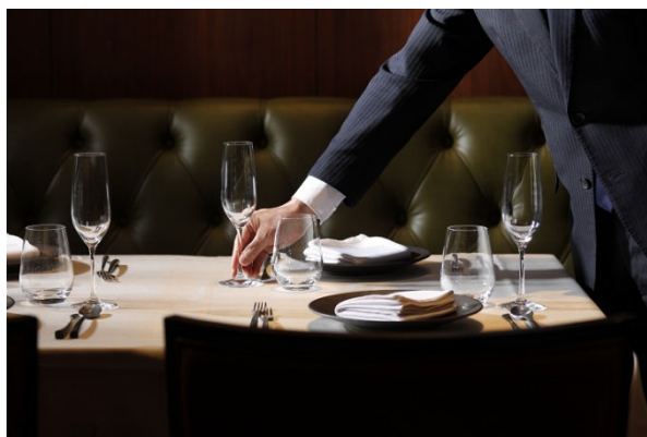
親子で学べるテーブルマナー(イメージ)

日本美のミュージアムホテル、ホテル雅叙園東京(所在地:東京都目黒区 / 総支配人:吉澤真一郎)では、夏休み特別企画として、小学生のお子様とその両親を対象にした「親子で学べるテーブルマナー」を8月8日(土)から10日(月・祝)の3日間、「親子アートツアー」を8月1日(土)から8月22日(土)までの毎週火・土曜日に開催いたします。夏休みの自由研究や思い出作りにご家族での参加をお待ちしております。