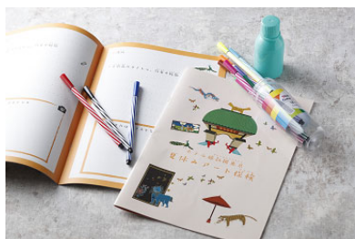
オリジナルスケッチブック(イメージ)

https://www.hotelgajoen-tokyo.com/archives/52461