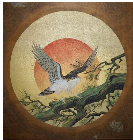
写真左 漁樵の間、「松と大鷹」 磯部草丘(草丘の間)

ホテル雅叙園東京は、鮮やかな日本画や、黒漆に蝶貝をはめ込んだ螺鈿など約 2,500 点もの美術工芸品が館内に点在する、唯一無二のミュージアムホテルです。中でも 1935 年(昭和 10 年)に建てられた「百段階段」は、当ホテルに現存する唯一の木造建築で、創業当時の風景をいまに伝える場所でもあります。近年は数々の企画展の舞台となっており、日本画の大家である かぶらきよかた 鏑木清方や、 あらかじつぼ 荒木十畝をはじめ、当時の著名な芸術家たちがつくりあげた彫刻・建築・工芸など、まさに“美術の殿堂”と呼べる場所となっています。