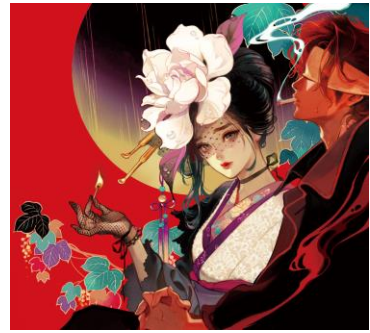
谷崎潤一郎×マツオヒロミ『秘密』

文豪の名作に現代の人気イラストレーターがイラストを添えるコラボレーション・シリーズ「乙女の本棚」(立東舎)との共演のもと、幅広い層から支持を受ける6名の人気作家により鮮やかに現代リミックスされたイラストをパネル展示いたします。文豪たちの不朽の名作が新たな魅力で蘇ります。