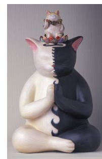
「猫の一生」(もりわじん作)