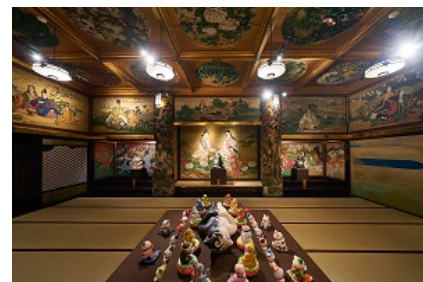
混沌神と泣き猫(漁樵の間)

お寺にも所蔵され、現代の猫アートの仏師ともいえるもりわじんの作品がさまざまなテーマで展開します。神-五大招福猫(十畝の間)、死-混沌神と泣き猫 100 体(漁樵の間)、生-誕生日猫 366 体(静水の間)、楽-愉快で自由な猫たち(星光の間)、創-古今東西の神話や伝説をもとに創作した 50 匹の不思議な世界(清方の間)、げんかつぎ猫百覧会(頂上の間)といった魅力あるラインナップです。