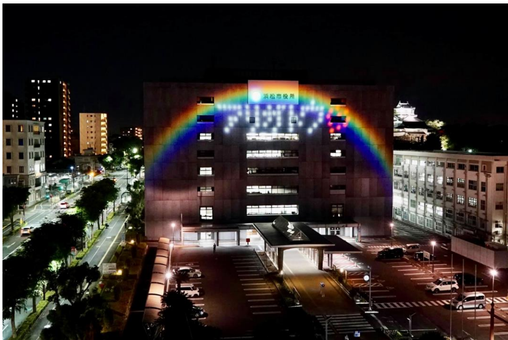
浜松市役所への光文字の投光「アリガトウ・ライトアップ」