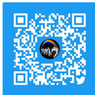
ホロライト・ツイート公式ツイッター (@HOLOLIGHT_tweet)