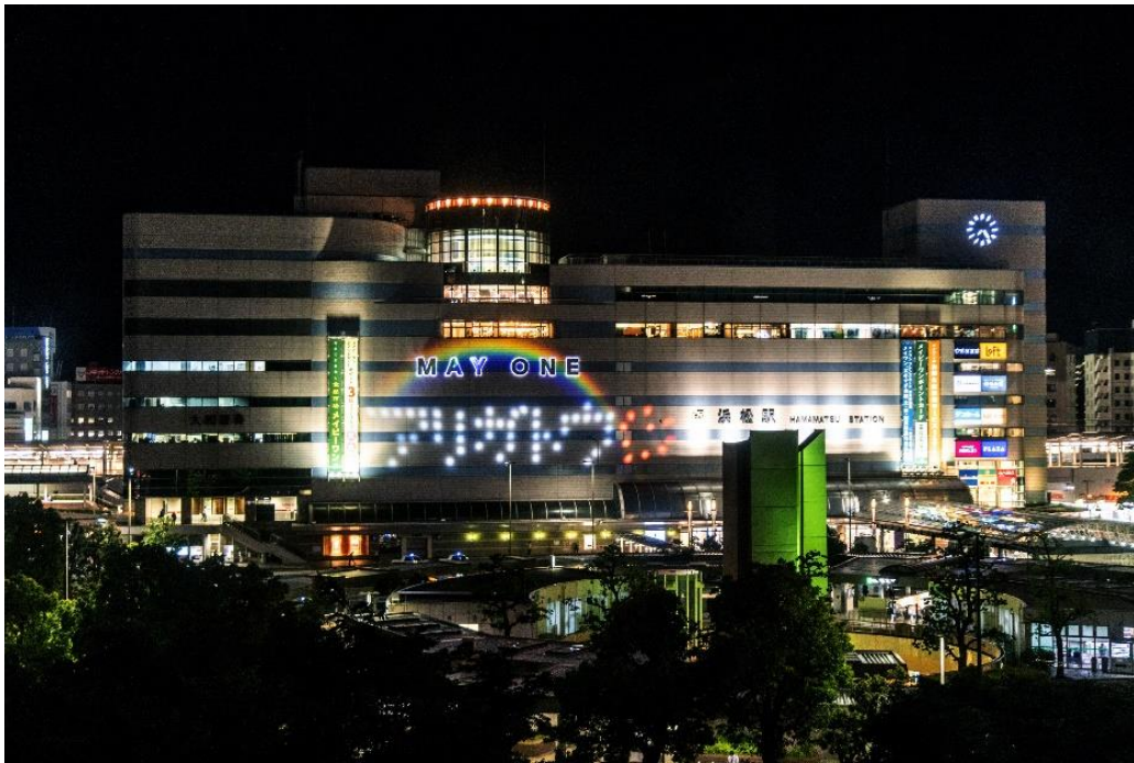
JR浜松駅ビルへの光文字の投光「アリガトウ・ライトアップ」

2020年4月24日から同年5月末までの金曜日に浜松市が実施した浜松市フライデー・オペレーションでは、新型コロナウイルス感染症の拡大が続く中、最前線で働く医療・介護従事者などの皆さまへ感謝の気持ちを伝えるため、浜松駅ビル「メイワン」の壁面に「アリガトウ」と「ハート」の光文字と「虹」を投光する照明協力を実施しました。2020年5月29日および12月23日から25日には、浜松市役所へ光文字を投光した実績があります。