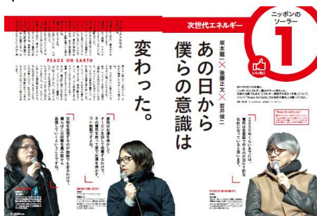
坂本龍一×後藤正文×岩井俊二の次世代エネルギートーク