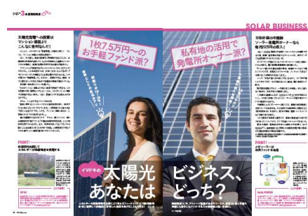
最新の太陽光発電投資ビジネス事情