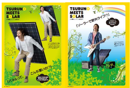
つるの剛士、ソーラーに挑みます！