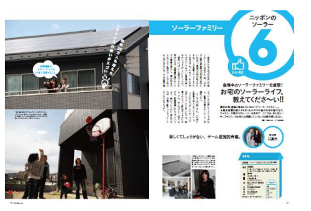
太陽光パネルを設置した家族取材