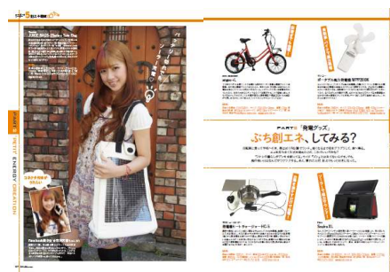
急増するソーラー発電雑貨特集！