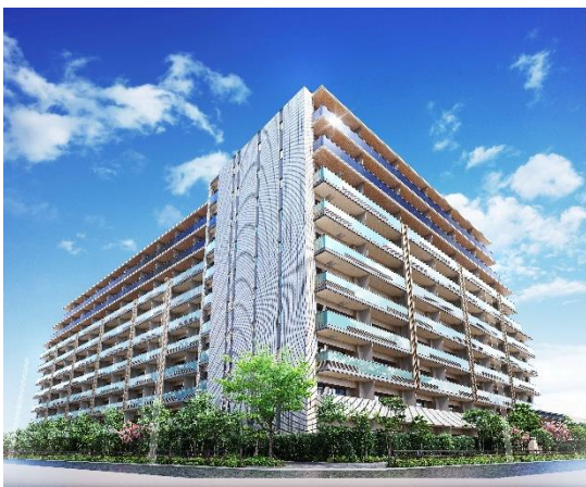
ジオ板橋大山外観 完成予想CG

https://www.doronko.jp/facilities/popinzu-oyama/