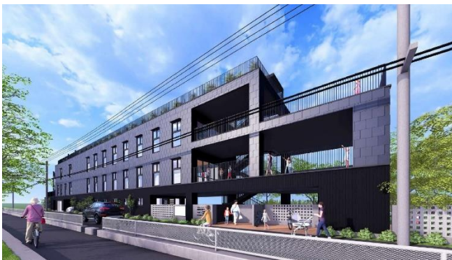
上目黒どろんこ保育園と発達支援つむぎ 上目黒ルームのイメージ

https://www.doronko.jp/facilities/doronko-kamimeguro/