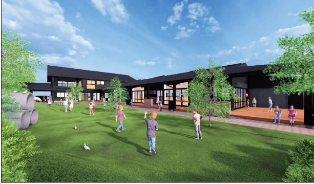
百目木どろんこ保育園と発達支援つむぎ 百目木ルームのイメージ

https://www.doronko.jp/facilities/doronko-domeki/