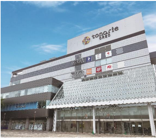
トナリエつくばクレオ 外観

https://www.doronko.jp/facilities/popinzu-tsukubaekimae/