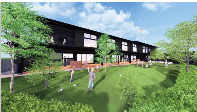
小平どろんこ保育園のイメージ

https://www.doronko.jp/facilities/doronko-kodaira/