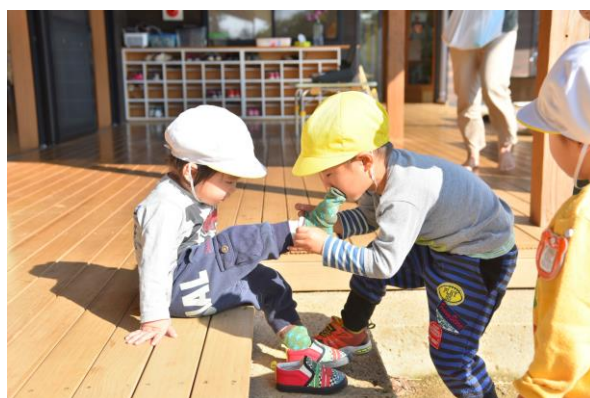
違いを認めて頼りあい、手を差し伸べ合うことを学ぶ子どもたち

東大和市のこの施設は どんこ会グループとして初の「児童発達支援センター」と「認可保育所」の併設モデル となります。