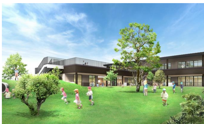
（仮称）東大和市児童発達支援センターおよび認可保育所等のイメージ