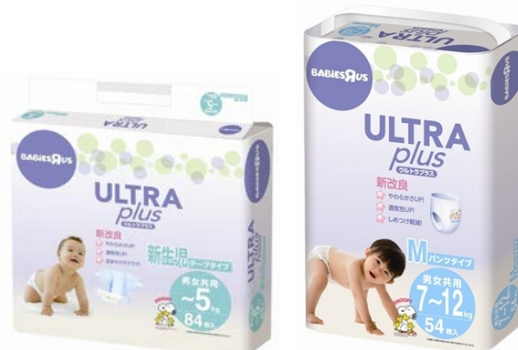
(左)ウルトラプラス <テープタイプ> 新生児サイズ (右)ウルトラプラス <パンツタイプ> Mサイズ

© 2012 Peanuts Worldwide LLC www.SNOOPY.co.jp