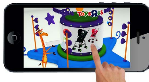
【3Dシアターのイメージ】

「ベビー用品カタログ」は、「トイザラス・ベビーザラス 公式アプリ」( www.toysrus.co.jp/app )を使ってAR体験をお楽しみいただけます。アプリを起動したスマートフォンで、アプリ内の「かざすカメラ」からカタログに掲載のチャイルドシート、ベビーカー、抱っこ紐の対象ページを読み取ると、スマートフォンの画面から「バーチャルスタッフ」が登場し、商品情報や商品選びのポイントをご紹介します。また、同ページの「オススメ！」マークがついた対象商品の動画を配信するとともに、「トイザラス・ベビーザラス オンラインストア」( www.toysrus.co.jp )のショッピングページに自動的にリンクすることで、お客様には手間なく商品をご購入いただけるようになります。さらに、カタログの表紙にワクワク感満載の「3Dシアター」を搭載し、カタログ内のおすすめ商品を一目でご覧いただけます。