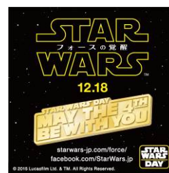
ピンバッジ (イメージ)

4月29日(水・祝)～5月8日(金)の期間中、お台場で「スター・ウォーズ」商品を1,000円以上(税抜)ご購入いただいた方を対象として、毎日先着300名様に「スター・ウォーズ」のキャラクターデザインのマグネット(非売品)をプレゼントします。また、神戸ハーバーランド店では、「スター・ウォーズの日」である5月4日(月・祝)に、「スター・ウォーズ」商品を1点以上お買い上げいただいた方先着300名様に、オリジナルピンバッジ(非売品)をプレゼントします。