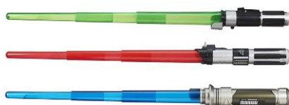
※ライトセーバーの一例

スター・ウォーズ ライトセーバー 各種 1,834 円～7,558 円(税込)※ ※: 2015 年 4 月現在