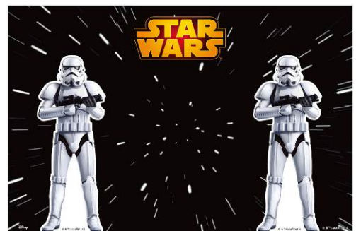
フォトパネル (イメージ)