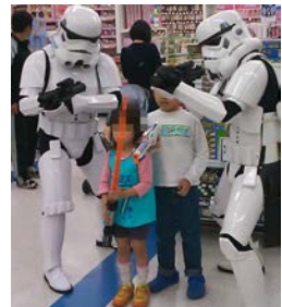
イベントの様子 (イメージ)

開催内容：4月25日(土)にオープンする『Destination Star Wars』を記念して、「ダース・ベイダー」と「ストームトルーパー」がお台場店に登場する予定です。当日は、キャラクター達と一緒に記念撮影をお楽しみいただけます。(整理券配布予定)