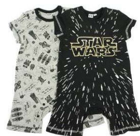
※カバーオール一例

ダース・ベイダー3D デコライト/ ショップジャパン 5,290 円(税込) 4/下旬発売