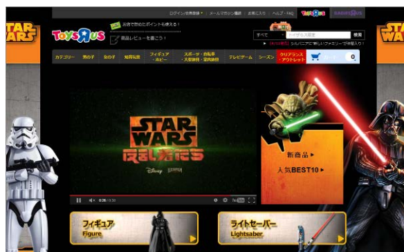
『Destination Star Wars』バーチャルショップ (イメージ)

「トイザらス・ベビーザらス オンラインストア」では、『Destination Star Wars』のバーチャルショップ ( www.toysrus.co.jp/f/CSfStarwars.jsp )を展開しています。実店舗と同様に、「スター・ウォーズ」商品を幅広い品揃えでご用意し、お客様は、「フィギュア」「ライトセーバー」といったカテゴリーごとに、お探しの商品を簡単にお選びいただくことができます。劇中のシーンを彷彿させるページデザインや『スター・ウォーズ 反乱者たち』の映像放映、新商品・人気商品の最新情報など、見ていだけでワクワクするようなエンターテインメント性に溢れるコンテンツをご用意します。今後も映画公開に向けて、サイトの充実化を継続的に図っていきます。