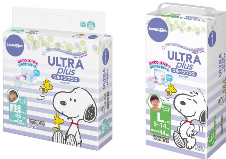
(左)ウルトラプラス <テープタイプ> 新生児サイズ (右)ウルトラプラス <パンツタイプ> Lサイズ

今回のリニューアルでは、特にお客様からご要望が多かった、「柔軟性」と「吸収力」の向上に取り組みました。赤ちゃんのお肌が当たる表面素材を変更することで、ふんわり・なめらかな肌触りを実現するとともに、ポリマーの使用量を増やし、従来品よりおしっこ吸収量を高めています。ラインナップは、テープタイプ(新生児、S、M、Lサイズ)とパンツタイプ(M、L、ビッグ、ビッグより大きいサイズ)の2種類で、全商品999円(税抜) ※1 の新価格にてご提供いたします。大人気の「スヌーピー」を大きくあしらった新パッケージで、おむつ本体のデザインも刷新し、ママ、パパのおむつ替えの時間を楽しく演出いたします。