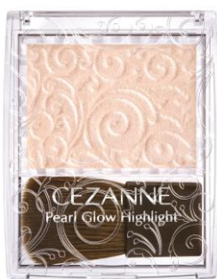
01 シャンパンベージュ