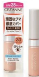
ストレッチコンシーラー 30

オレンジ色の効果で濃い色を補正。眉周りの剃り跡や目の下のクマのカバーにもおすすめです。男性にも髭剃り跡のカバーとしてお使い頂けます。