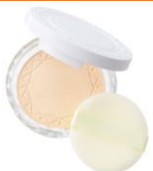
UVクリアフェイスパウダー