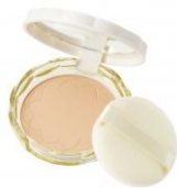
UVシルクカバーパウダー