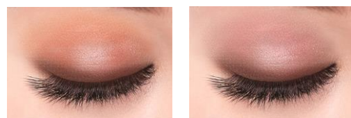
09ブリックブラウン 10ベリーブラウン