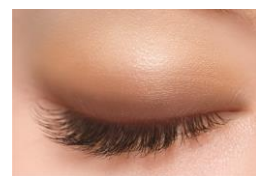
04 キャメルブラウン