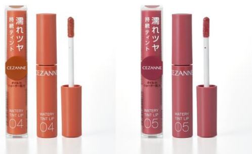
04キャメルオレンジ 05プラムレッド

きっと欲しい色が見つかる全9色展開！ 挑戦カラーも試しやすい638円（税込）です。