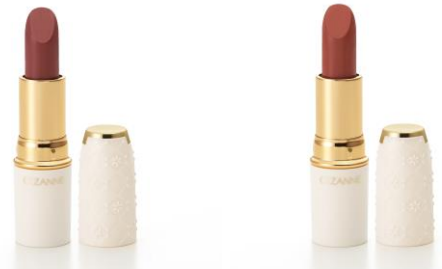
新色 105 ブラウン系

また、オレンジ×ブラウンの絶妙なレンガ色のテラコッタカラーは、ひと塗りで一気におしゃれ顔に。いつものメイクに変化を出したいとき、ニュアンスとしてプラスしてもOK！自分好みの塗り方をぜひ探してみてくださいね。