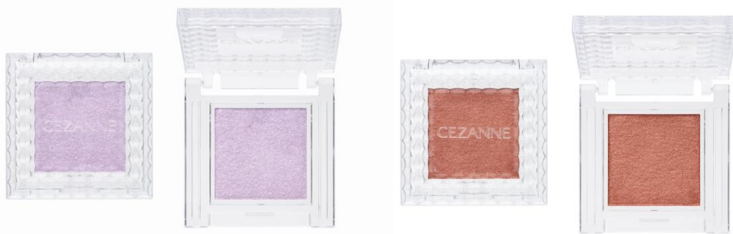
新色 05 ピュアラベンダー

また、肌なじみの良いオレンジぼさが残る「オレンジブラウン」は、ひと塗りで抜け感が出てオシャレ度アップ。目元を柔らかく締めつけてくれて、中間色としても締めめ色としても使える優秀カラーです。