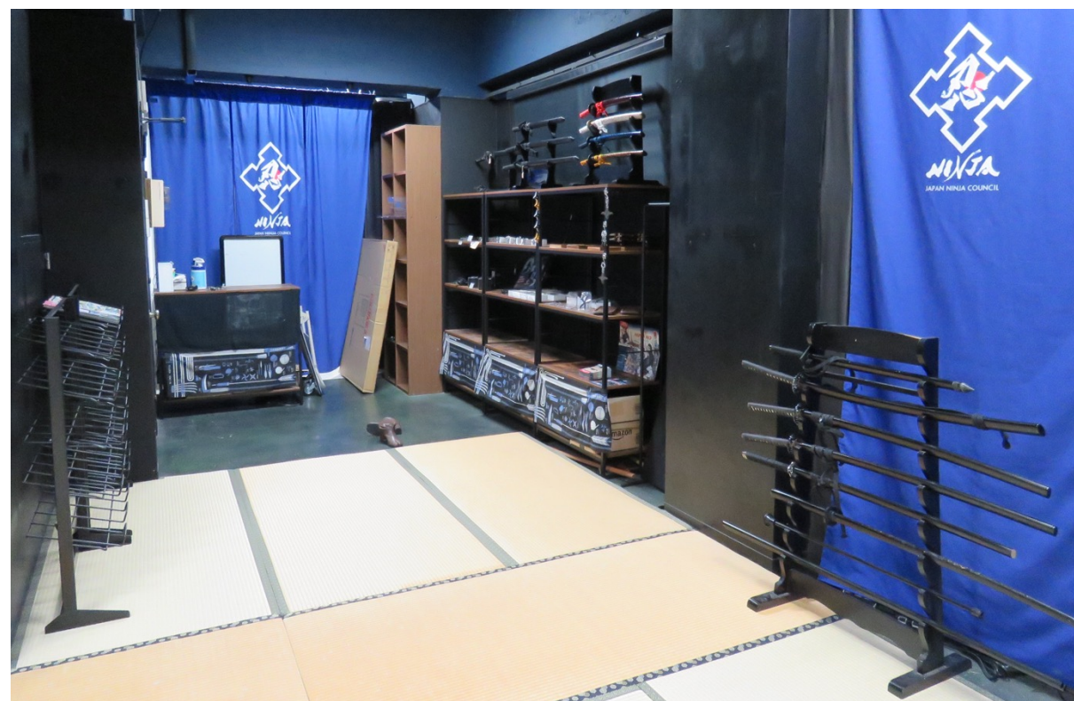
物販棚 → 受付カウンター