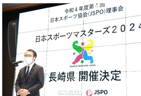
開催地決定を受け、大石長崎県知事から挨拶