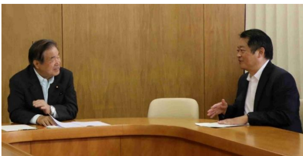
遠藤会長(左)と長崎知事(右)の会談