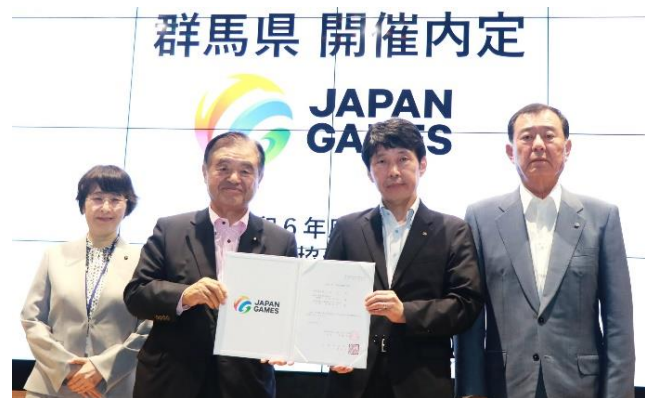
(左から)平田郁美教育長(群馬県教育委員会)、 遠藤利明会長(JSPO)、山本一太知事(群馬県)、 遠藤祐司会長(群馬県スポーツ協会)