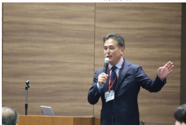
日本サッカー協会の事例発表