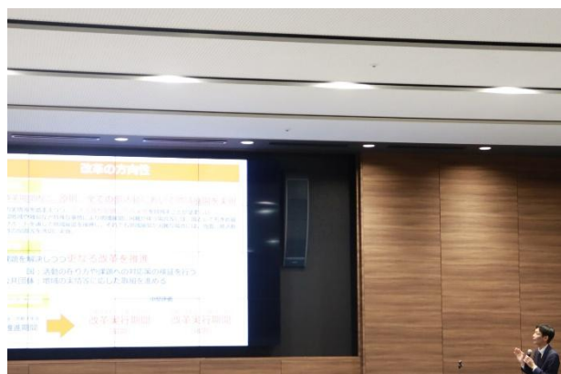
スポーツ庁からの情報提供