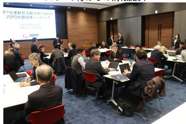
グループディスカッションの様子

本ミーティングを通じて、参加者からは、運動部活動改革に向け、特に指導者の育成・活用について課題を共有するとともに、今後の組織運営につながるヒントを得たとの声がありました。