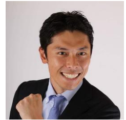
総合 MC ここにわ氏

総合 MC: ここにわ氏 (ものまね等のタレント活動に加え、数多くのスポーツイベント MC やスポーツ応援団長等に就任)