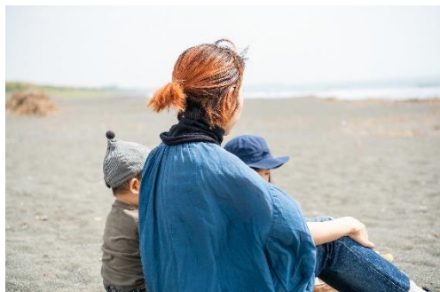
ネックカバー使用时

広げて筒状の状態で使用すれば、眠るときの髪の毛の摩擦によるダメージを軽減してくれます。帽子として使う際と同様に、締め付けないので睡眠を妨げません。