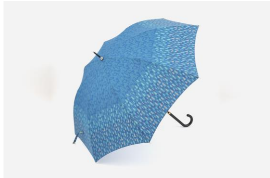
レイクフォレスト (ネイビーブルー)