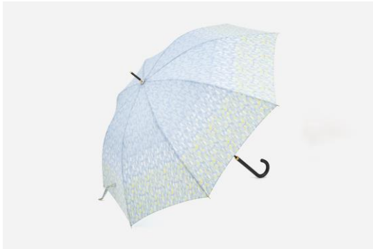
レイクフォレスト (ライトブルー)