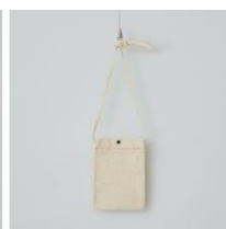
キャンバスサコッシュ 横17cm×縦24cm