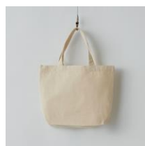
キャンバストートバッグ(S) 横25cm×縦22cm マチ10cm