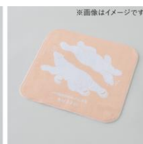
ハンドタオルハンカチ 縦20cm×横20cm