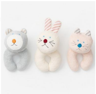
フレンズシリーズ