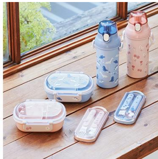
はじめての水筒・弁当箱