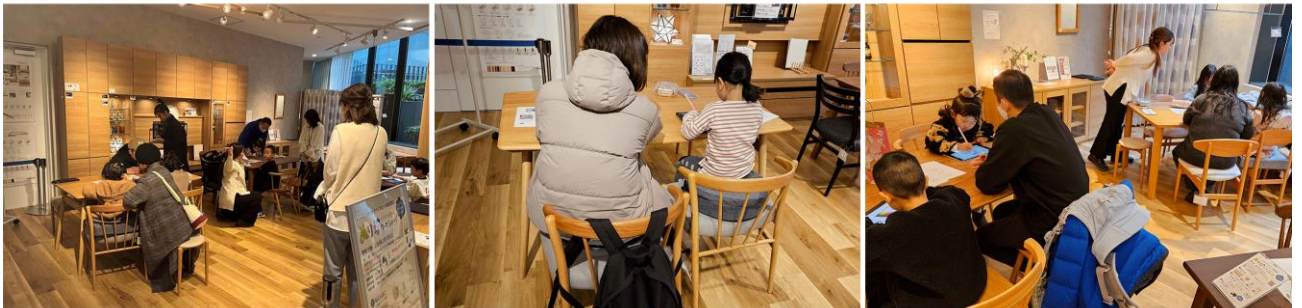
ワークショップ会場の様子

参加者からは、「とても楽しい思い出ができた」、「子供も初めてのデジタルでお絵描きをしたのでよい機会だった」、「子供が書いてくれた絵を日常使いの物として残せるのでうれしい。」などの感想が聞かれました。