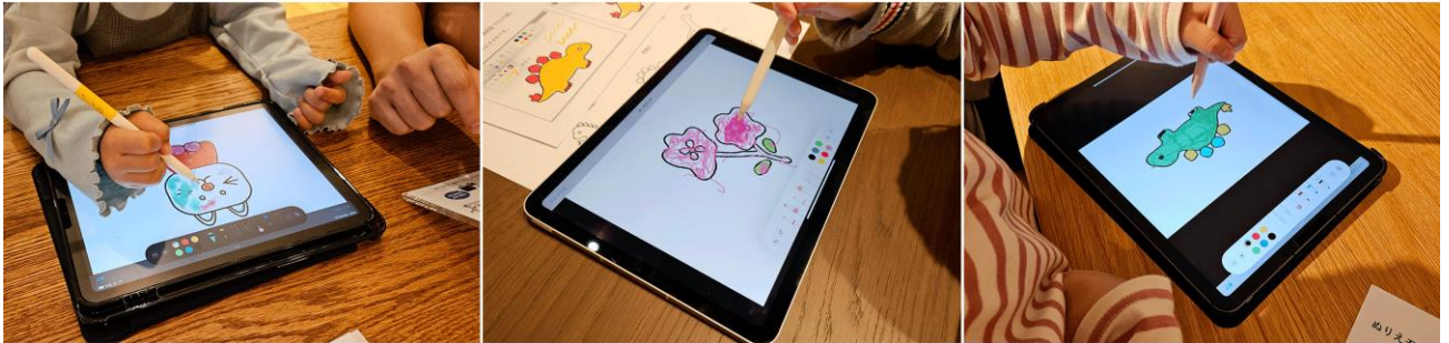
iPadでのぬりえの様子

ワークショップでは、トートバッグ、サコッシュ、ハンカチの3種類からお選びいただき、9種類のお好きなモチーフをiPadでぬり絵していただきました。普段慣れ親しんでいるぬり絵がiPadのデジタルな世界で楽しめ、ご参加いただいた皆様が自由に塗って楽しまれていました。