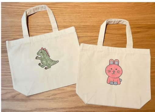
お好きなアイテムにプリント