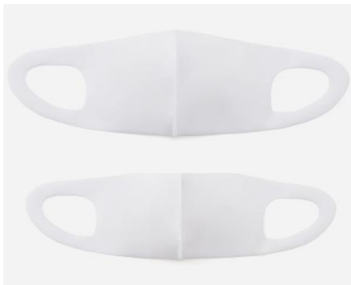
画像上：新発売の通常サイズ／下：Sサイズ

UVカット・遮熱機能付き。国産「接触冷感ひんやりクールマスク」のバージョンアップとは？