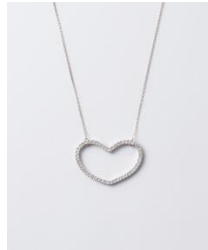
Anna Diamond necklace medium PT950 ¥440,000 PT950・ホワイトダイヤモンド 0.6 ct up