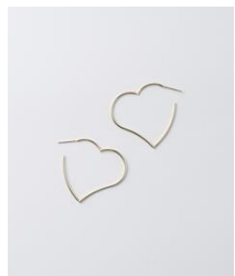
Heart pierce ¥121,000 K10YG