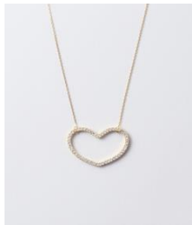
Anna Diamond necklace medium K18YG ¥462,000 K18YG・ホワイトダイヤモンド 0.6 ct up