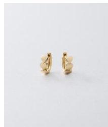
Baby Loop ¥121,000 K10YG