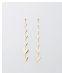
Cascade SINGLE pierce ¥74,800 K10YG