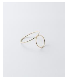
Sphere ring ¥132,000 K10YG