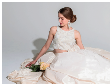
オーインベリアル / Eau Impériale