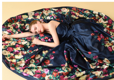
ネイビー・バルマローザ / Navy Palmarosa

今回発表する新作のテーマは「香り」。「香り」は記憶と結びつきやすく、思い出や感情を呼び起こしやすいと言われていています。香りをテーマとしたドレスをお召しいただくことで、衣裳合わせや挙式当日の“ドレスを着た瞬間”を結婚式の後も思い出して欲しいという想いを込めて製作いたしました。ウエディングドレスは、ロングスリーブのエlegantなものから、フェミニンなマーメイドラインまで幅広いデザインをラインアップ。カラードレスは、フラワープリントを配した華やかなものや、毎シーズン変わらぬ人気をもつ、タイトなウエストにボリュームたっぷりのスカートを合わせたデザインをご用意しております。