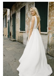
Tahlula Solid Gown