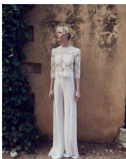
Tops : BR1948 Trousers : BR1947

伝統的なチュール技術と見事なカットワークから生まれるCostarellosのドレスは、身につけるだけでロマンティックな気分が高まるフェミニンで優美なデザインが特徴です。全身を優しく包み込む美しいデザインは見た人が思わず目が離せなくなるようなファッション性も兼ね備えています。今回は新たに、Costarellosならではの繊細なレースのロングスリーブドレスとセパレートのパンツスタイルのドレスがラインナップに加わります。